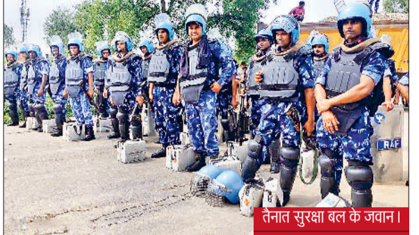
तेनात सुरक्षा बल के जवान