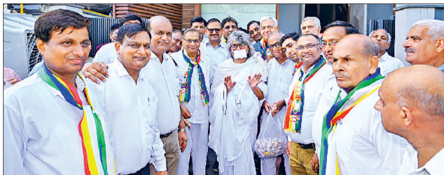
पानीपत। जैन संत का स्वागत करते हुए श्रद्धालुगण।