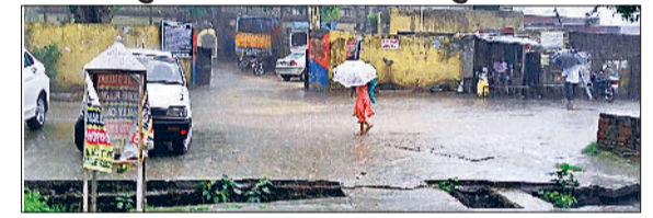
यमुनानगर में हुई बरसात में भीगते हुए अपने गंतय पर जाते हुए लोग।

यमुनानगर। लंबे अरसे से मौसम में बनी उमस व गर्मी की तपिश झेल रहे जिलवासियों को बुधवार को हुई झमाझम बारिश से राहत मिली। बारिश होने से मौसम सुहावना बन गया। वहीं, बारिश होने से किसानों के चेहरे भी खिल गए। बुधवार सुबह जाग लोग नींद से जागे तो आसमान में कहीं-कहीं बादल छाए हुए थे और मौसम में उमस व गर्मी की तपिश बनी हुई थी। लोग अपने काम धंधों पर परतनी-परतनी हो रहे थे। मगर दस बजे के करीब अचानक आसमान में धने बादल छा गए और बारिश शुरू हो गई। करीब दो घंटे तक जिले में कहीं तेज तो कहीं हल्की बारिश हुई। आलम यह रहा कि बारिश थमने के बाद भी शाम तक आसमान में बादल छाए रहे और मौसम सुहावना बना रहा।