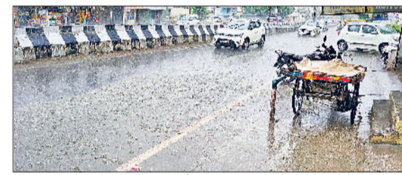
कुरुक्षेत्र। बारिश में अपने गंतय की ओर जाते वाहन चालक।

धर्मनगरी में लोगों के लिए बुधवार की सुबह गर्मी से राहत लेकर आई। सुबह ही आसमान में छाए बादलों ने साढ़े 9 बजे के बाद बरसना शुरू किया तो शहर भर की सड़कें पानी से लबालब हो गईं। करीब दो घंटे भर में हुई करीब 22