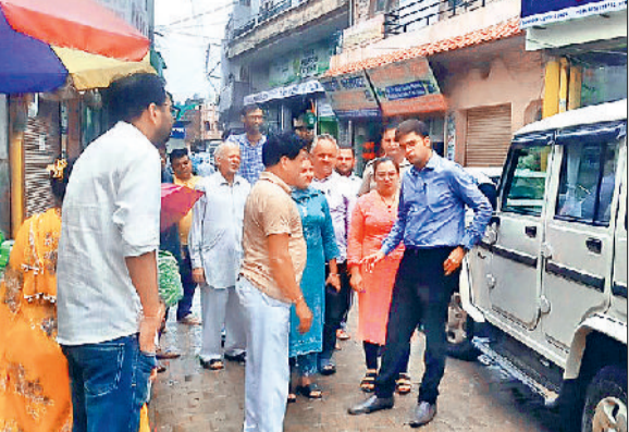
शहजादपुर। बरसाती पानी की निकासी का जायजा लेते हुए एसडीएम।