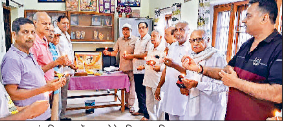
बराड़ा। श्रद्धांजलि सभा में भाग लेते वरिष्ठ नागरिक