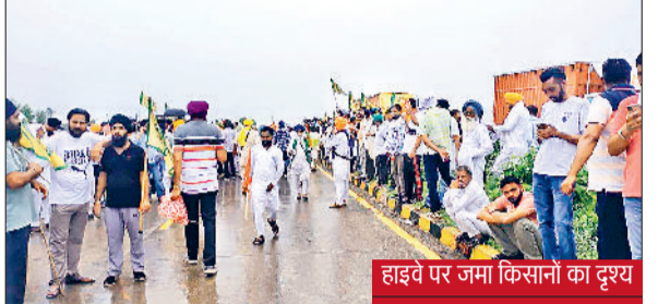
हाइवे पर जमा किसानों का दृश्य