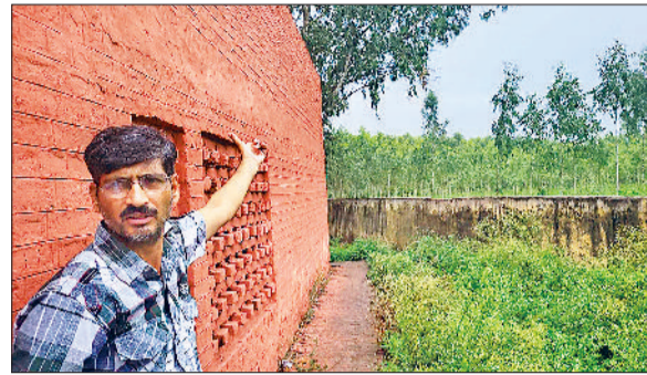
मौका दिखाते हुए पीटीआई टीवर

तेंदुए पर पड़ गई। इसके बाद बच्चे सहम गए। कई बच्चे तो उर के मारे रोने लगे। तभी पीटीआई अध्यापक ने हिम्मत जुटाकर बाहर निकला। हालांकि तब तक तेंदुआ खेतों में कूद चुका था। इसके बाद अध्यापकों ने