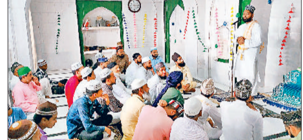
अंबाला। मोहरम के दौरान मौजूद मुस्लिम समुदाय के लोग।